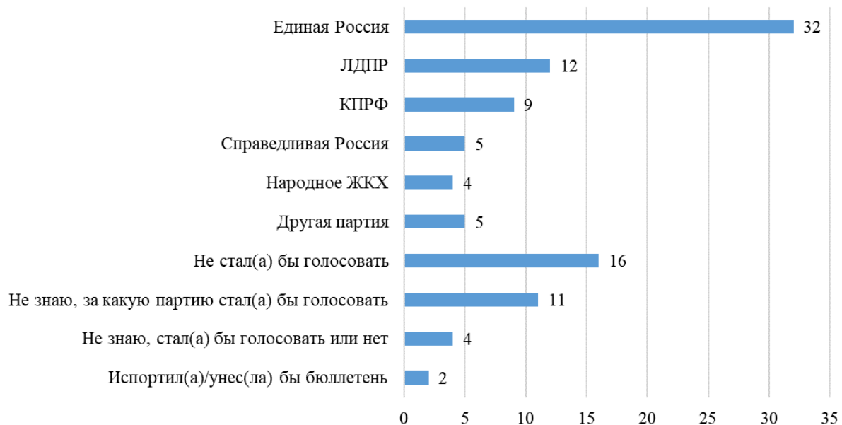
График 3: Готовность голосовать (по данным вопроса «Какую из политических партий Вы готовы поддержать на выборах в Государственную Думу, если выборы состоятся в ближайшее воскресенье?», один ответ, в %% от числа всех опрошенных)

Немного чаще говорили, что готовы поддержать партию Народное ЖКХ на выборах те, кто не удовлетворен качеством оказываемых услуг (6%), среди тех, кто удовлетворен услугами ЖКХ таковых 2%.