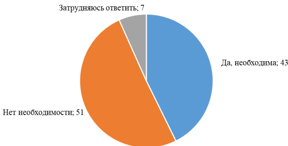
График 2: Мнение о необходимости создания новой партии (по данным вопроса «Как Вы считаете, необходима или нет новая политическая партия, которая создана для решения проблем ЖКХ?», один ответ, в % от числа всех опрошенных)

При этом партию Народное ЖКХ поддержать на выборах в Государственную думу готовы 4%, в прошлой волне за партию СтопЖКХ были готовы голосовать такое же количество россиян – 3%. Готовность отдать голос за новую партию выше среди женщин (5%), молодежи (6%), жителей крупных (500-100 тысяч жителей) городов (7%) и людей с низкими доходами (5%) (см. График 3 ).